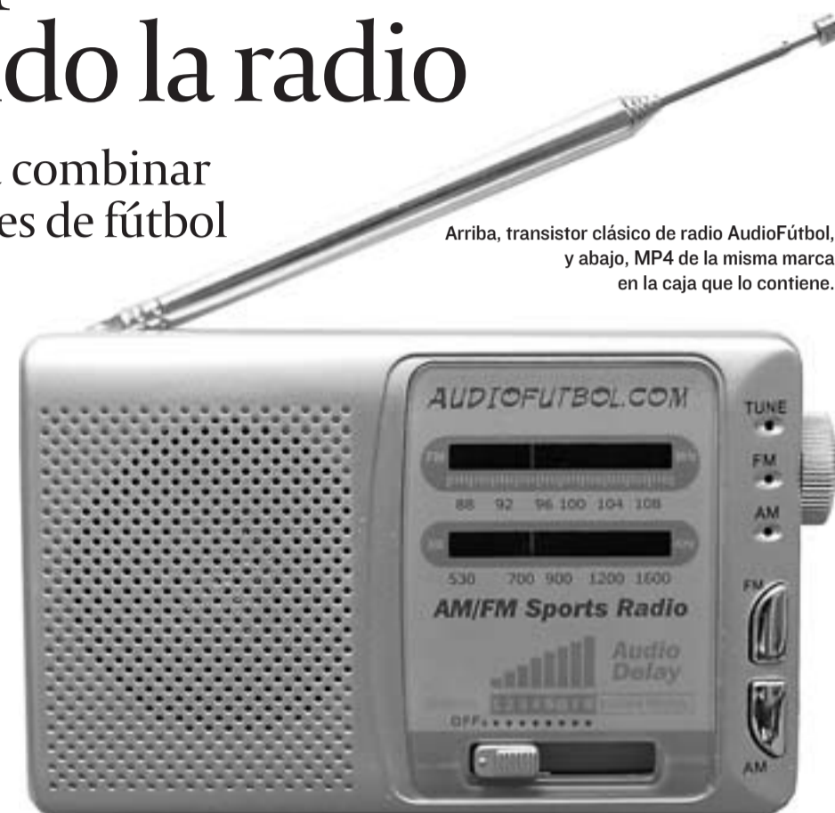
Arriba, transistor clásico de radio AudioFútbol, y abajo, MP4 de la misma marca en la caja que lo contiene.

Algunas pequeñas empresas españolas están desarrollando sus propias soluciones. Es el caso de ClacSoft, que ha diseñado ClacRadio, un software que permite retardar el sonido de la radio, mientras Sysetec Service comercializa AudioFútbol, que retrasa la señal de